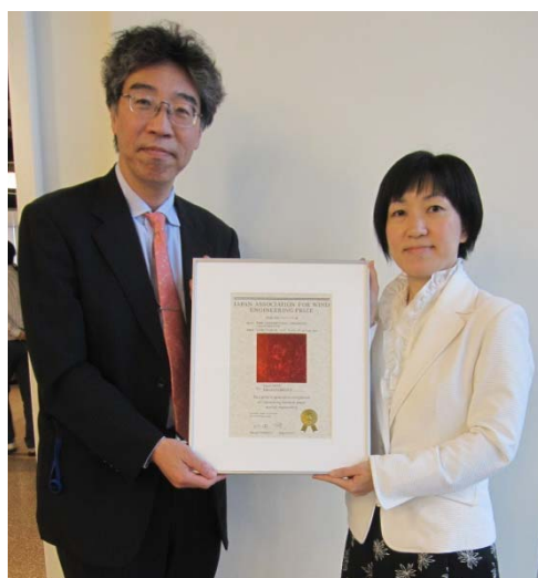
図 1 日本風工学会ベストペーパー賞と授賞式の写真