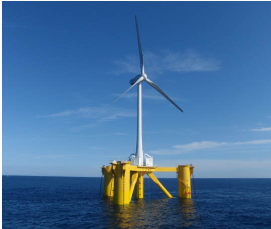
2MW ダウンウィンド型浮体式洋上発電設備 「ふくしま未来」(浮体形式：コンパクトセミサブ)